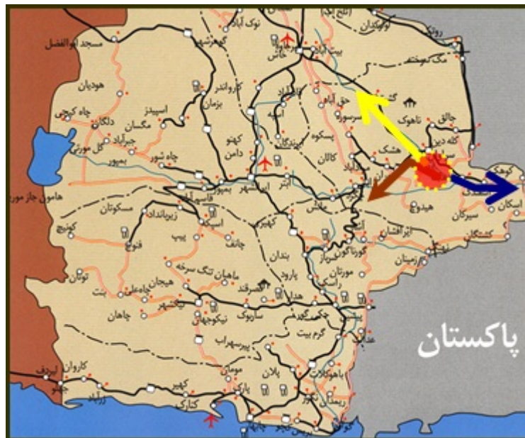
شکل (۲) نمایی از محورهای اصلی منطقه نمونه گردشگری کلپورگان با نواحی پیرامونی

مأخذ: سازمان میراث فرهنگی، صنایع دستی و گردشگری