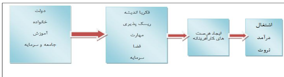
شکل شماره (۱): روند کارآفرینی یا اکوسیستم کارآفرینی

واژه کارآفرینی از کلمه فرانسوی Entrepreneur به معنای متعهد شدن نشأت گرفته است. بنابر تعریف واژنامه دانشگاهی وبستر، کارآفرین کسی است که متعهد می‌شود مخاطره‌های یک فعالیت اقتصادی را سازماندهی، اداره و تقبل کند (احمدپورداریانی، ۱۳۸۷: ۴). عمل کارآفرینی اشاره به کشف، ارزیابی و بهره‌برداری از فرصت‌ها (Shane et al., 2000: 219) و شناسایی فرصت‌های قابل دوام و پایدار است (Martin et al., 2010: 482) و می‌توان آن را معادل نوآوری تعریف کرد (Lauwere et al, 2002: 3) که باعث ایجاد هیجان و انگیزه و همچنین رشد و پیشرفت اقتصادی می‌شود (Pablo Couyoumdjian, 2012: 158). کارآفرینی باعث خلق نوآوری و قبول مخاطرات و منافع آن است (Hisrich et al., 2005: 8). در شکل ۱ روند شکل‌یابی کارآفرینی و ثمرات آن نشان داده شده است.